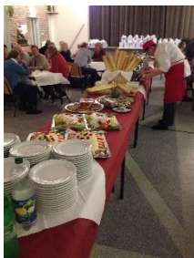
Het buffet op de vrijwilligersavond.

De Stichting maakt ten behoeve van de vrijwilligers gebruik van de vrijwilligersverzekering van de Gemeente Elburg. Dit betreft een secundaire verzekering. De Vereniging Voedselbanken Nederland heeft ook enkele verzekeringen gesloten voor de aangesloten voedselbanken.