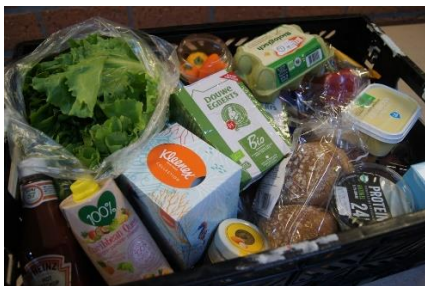
Een voedselpakket voor 2 personen.

's Middags om 13.30 uur begonnen de inpakkers het voedsel over de pakketten die bestemd waren voor Elburg en 't Harde, te verdelen. Er zijn vier soorten pakketten: pakket 1 voor alleenstaanden, pakket 2 voor twee personen, pakket 3 voor gezinnen van drie en vier personen en pakket 4 voor gezinnen van vijf en meer personen. Bij een paar klanten werd het voedselpakket thuisbezorgd, vanwege bijzondere omstandigheden.