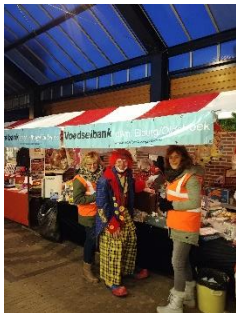
De activiteitencommissie op een markt.

De Activiteitencommissie probeerde door activiteiten te houden, geld te genereren voor de exploitatiekosten van de voedselbank en anderzijds om het publiek bekend te maken met het bestaan van de voedselbank in hun gemeente.