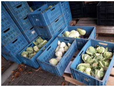
Een partij kolen.

In 2019 hebben alle herbeoordelingen plaatsgevonden. Bij de herbeoordeling werd gekeken op basis van de actuele financiële gegevens of klanten nog in aanmerking kwamen voor een voedselpakket.