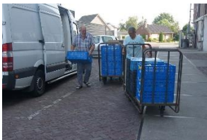
Transport van binnenkomende goederen van de supermarkten.

Twee chauffeurs gingen iedere morgen naar zes supermarkten om daar de goederen op te halen.