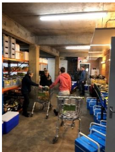
Klaarmaken van de voedselpakketten.

Onze samensteller van de voedselpakketten bekeek op maandag- en donderdagmiddag wat er uitgegeven kon worden en stelde daarvoor lijsten op. De goederen die op uit Arnhem komen worden uitgegeven en daarnaast een aantal uit eigen voorraad.