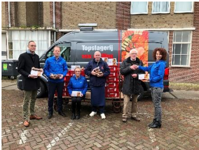
Overdracht van rollades en gehaktballen.

Supermarkt Plus De Vrijheid in Elburg hield wederom een actie om Kerstproducten voor de klanten van de voedselbank in te zamelen. De actie was een succes. Bij alle klanten konden we aan de wekelijkse voedselpakketten veel lekkere kerstproducten toevoegen.