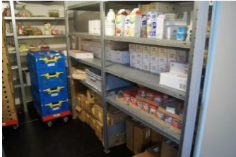
De nieuwe koelcel.

De inventaris bestond uit geschonken stellingen en een prachtige geschonken koel- en vriescel. Omdat de koelcel te klein bleek, heeft de Voedselbank uit eigen middelen medio april 2018 een nieuwe grotere koelcel aangeschaft.