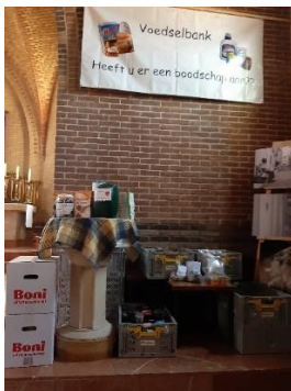
Inzameling door de Pastoraatgroep.

De Gereformeerde Kruiskerk Wezep zamelden zegeltjes in voor de boodschappendozen van de Plus Wezep. Dat leverde 15 boodschappendozen op.